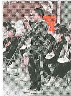
6年生からのお礼の言葉