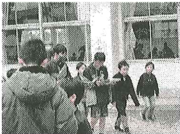
1年生と6年生のお別れ会